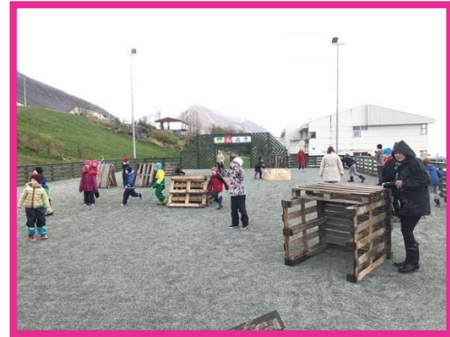
Skemmtilegasti leikurinn okkar Paintball-úti á vordegi 2018

Skólaslit og skólasýning fóru fram 1. júní við hátíðlega athöfn í kirkjunni. Skólasýningin var á sínum stað og Kvenfélagið Von sá um kaffisölu í Félagsheimilinu. Máltakið „Það þarf heilt þorp til að ala upp barn“ verður alltaf sterkt á skólaslita degi á Þingeyri.