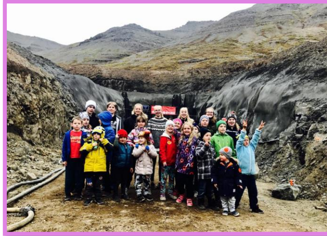
Nemendur við hátíðarsprengingu Dýrafjarðargangna 14. September 2017

Fimmtudaginn 14. september var hátíðar sprenging í fyrirhuguðum Dýrafjarðargöngum kl. 16 Arnarfjarðar megin. Þar sem nemendur við Grunnskólann á Þingeyri minntu á nauðsyn þessa gangna á "grænum degi" fyrir 8 árum með því að hefja gröft inni í firði vorum við að sjálfsögðu viðstödd á þessum merku tímamótum í nafni G.Þ. og æskunnar. Skólinn fékk styrk frá velunnara skólans og farið var saman á rútu á viðburðinn.