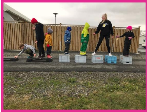
Samheldni, mynd frá vordegi 2018

leika á Þingvelli. Við skelltum líka á murikkuna laxi sem veiddur var í bátsferðinni út að kvíum. Bæði laxinn og hamborgararnir smökkuðust afbragðs vel.