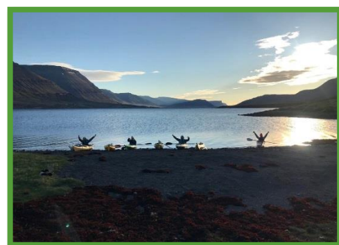
Kajakferð inn í Dýrafjarðarbotni, maí 2019

Skólaslit og skólasýning fóru fram 3. júní við hátíðlega athöfn í kirkjunni. Skólasýningin var á sínum stað og Kvenfélagið Von sá um kaffisölu í Félagsheimilinu. Máltakið „Það þarf heilt þorp til að ala upp barn“ á gjarnan við á þessum degi í þorpinu okkar og stemningin er hátíðleg.