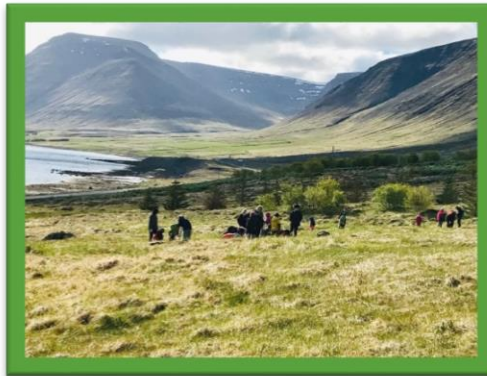
Gróðursetning í Yrkjureit skólans fyrir innan þorpið við rætur Sandafells, vor 2019