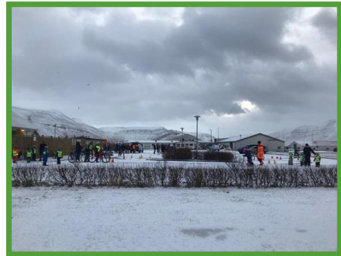
Frá öskudegi og hjóladegi í mars 2019