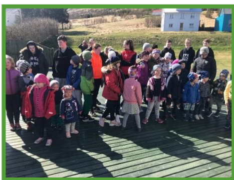
Vorganga, mynd tekin við Tjörn 2019

Í byrjun maí fórum við m.a. í vörgöngu með leikskólanum og sungum fyrir fólkið á Tjörn. Elsta stig fór í kajakferð í vali. Grænidagurinn var nýttur til gróðursetningar og tiltektar á skólalóð. Nemendur og starfsfólk gróðursettu að þessu sinni 201 plöntu í Yrkjureit skólans, sem er fyrir innan þorpið við rætur Sandafells. Veður var gott og grillaðar voru pylsur í hádeginu. Á vordaginn fór hvert námsstig fyrir sig í kynningu um fornleifaruppgröft hér fyrir innan Kjaranstaði. Umsjónarkennarar skipulögðu viðburði með sínum hópum, yngsta stig fór í þrautir á Víkingasvæði og krítuðu listaverk fyrir framan skólann í morgunsólinni, miðstig gekk upp á Sandafell og blés sápukúlur og elsta stig fór í bogfimi á Ísafirði. Í lok dags grillaði foreldra félagið hamburgara á skólalóðinni og við fórum öll saman í skemmtilegasta leikinn okkar „paintball“ á sparkvellingnum með vatnsblöðrum.