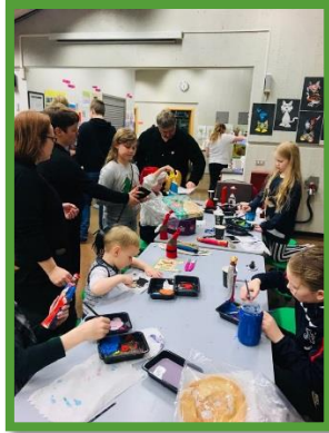
Jólafundur foreldrafélagsins og skreytingardagur G.P. des. 2018